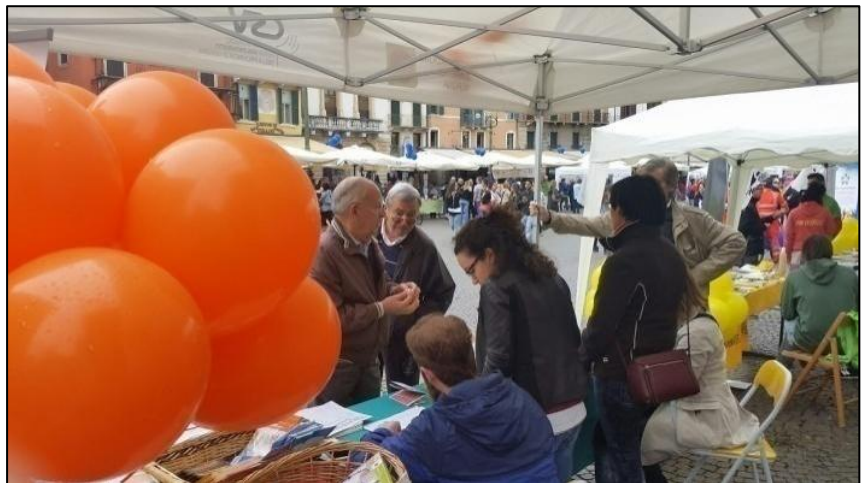
Foto della giornata del Volontariato