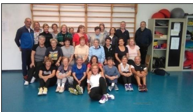
Immagini delle attività del corso di ginnastica dolce