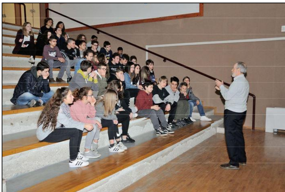
Incontri nelle istituzioni scolastiche