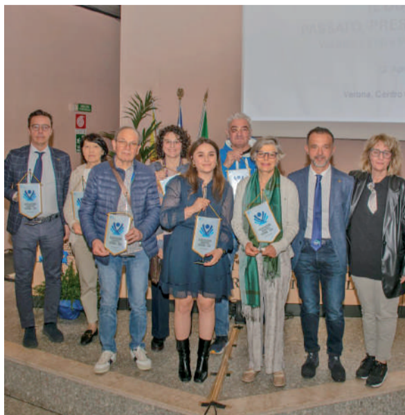
Consegna del gagliardetto ADV ai diabetici guida