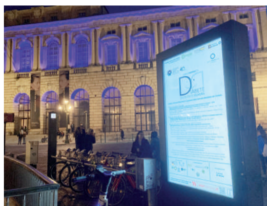
Il Palazzo della Gran Guardia illuminato di blu e uno dei totem digitali del Comune utilizzati per la promozione degli eventi promossi per la GMD da ADV a Verona e in Provincia